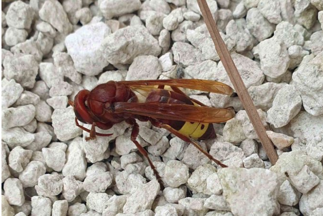
Orientalische Hornisse

Im September wurde eine Arbeiterin der Orientalischen Hornisse in Mannheim gesichtet. Es handelt sich höchstwahrscheinlich um ein Einzeltier, der Meldung wird nachgegangen. Es besteht kein Grund zur Beunruhigung!