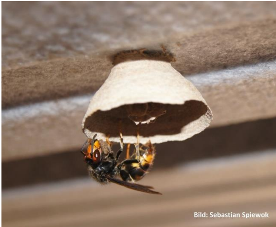
Königin beim Nestbau