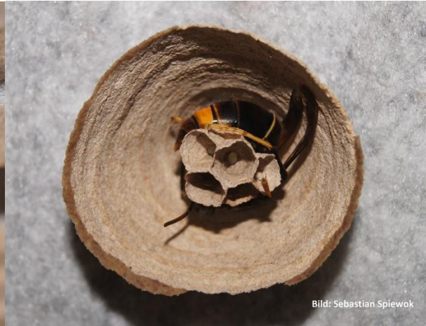
Königin wärmt die Brut

Folgende Möglichkeiten zur Vorgehensweise stehen Ihnen offen: