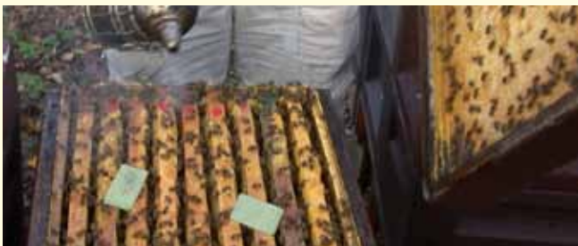
Die Behandlung mit Thymol dauert 6 Wochen. Die Dosierung erfolgt nach dem Prinzip »1+1«. Nach zwei Wochen die zweite Dosis zur ersten geben!

In Ausnahmefällen bei ungünstigen Standortbedingungen kann im Rahmen des Therapienotstandes Ameisensäure 85% in DAB-Qualität eingesetzt werden (Rezept des Tierarztes erforderlich, Bezug über Apotheken, siehe www.bienenkunde.uni-hohenheim.de ).