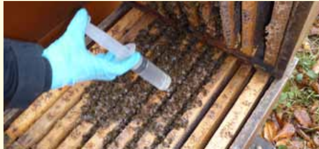
In jede besetzte Wabengasse der Wintertraube muss geträufelt werden!

Nur brutfreie Völker behandeln! Eine Anwendung genügt. Wenn Sie sich nicht sicher sind, wann der richtige Zeitpunkt ist, hören Sie unseren Ansedienst ab oder fragen Sie uns! Die Bruttemperaturfühler in den Stockwaagen des Trachtmeldedienstes bieten eine grobe Orientierung über die Brutttätigkeit der Völker in verschiedenen Regionen und Höhenlagen: www.badische-imker.de oder www.lvwi.de .